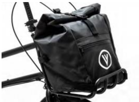
VELLO 貨架包 黑色

實用的前貨架，配有快速安裝裝置（可拆卸）。行李架不會影響 VELLO bike 的折疊和轉向。最多可承重 10 公斤。