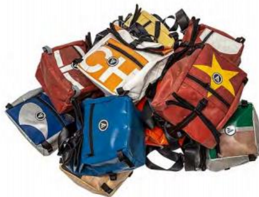
VELLO 貨架包 限量版

由回收的防水卡車油布製成，並配有可拆卸肩帶和提手。正面帶有高品質的 VELLO 標誌橡膠徽章，內有實用的隔層和帶拉鏈的前袋。主隔層為卷頂式，可按壓開合。4 條魔術貼帶可快速安裝在 VELLO 前背包上。