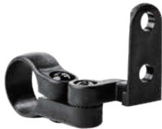
YC 20XE / 活动车把支架