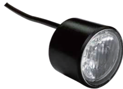
YC 125F / 前灯