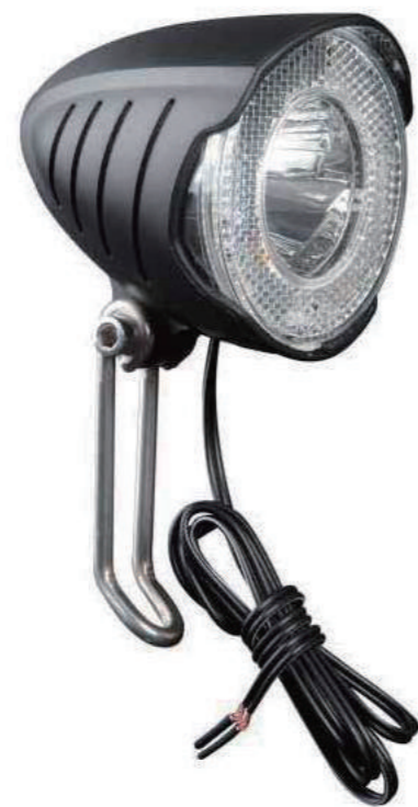
YC 019F / 前灯