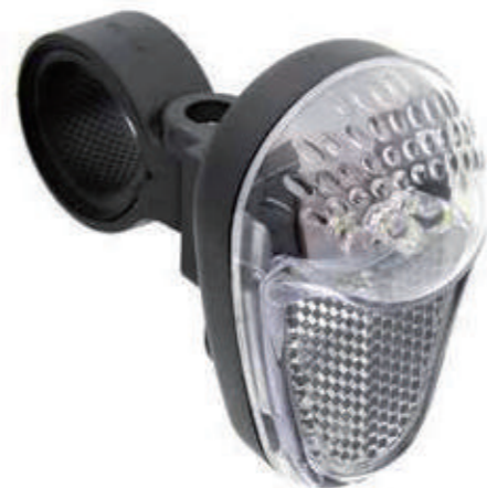
YC 993F / 电池前位置灯