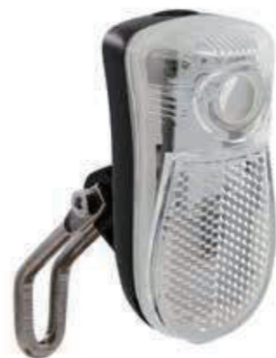
YC 106F / 电池前位置灯