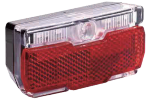
YC 008R / 后灯