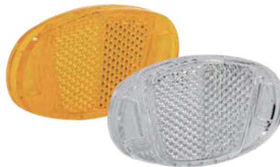
YC001P / 侧反射器

标准 / Standard AS | BS | CPSC | ISO | GB/T31887.2 | JIS