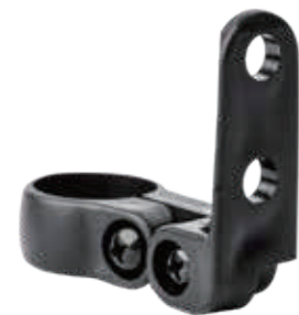
YC 40XE / 活动座管支架