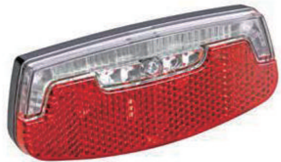
YC 019R / 后灯&电池后灯