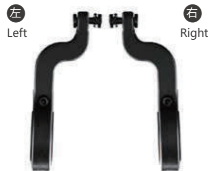
YC 14XE / 固定车把支架