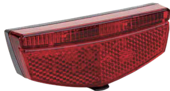
YC 262R / 电池后灯