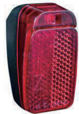
YC 127R / 后灯