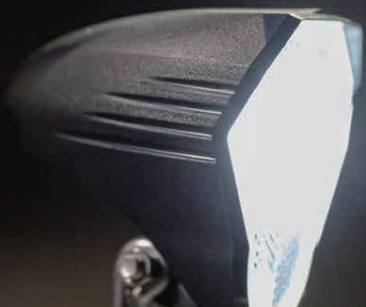
YC 010F / 前灯