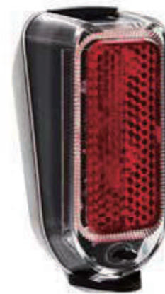
YC 231R / 电池后灯