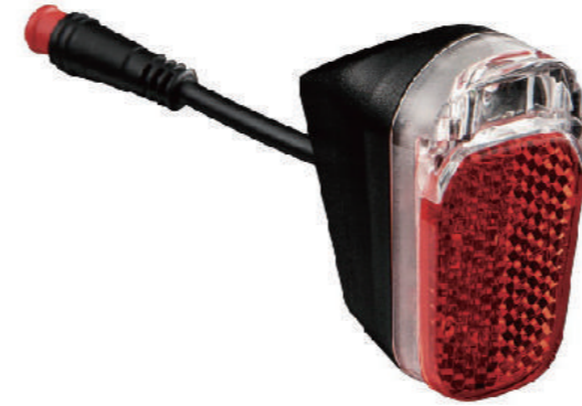
YC 339R / 后灯