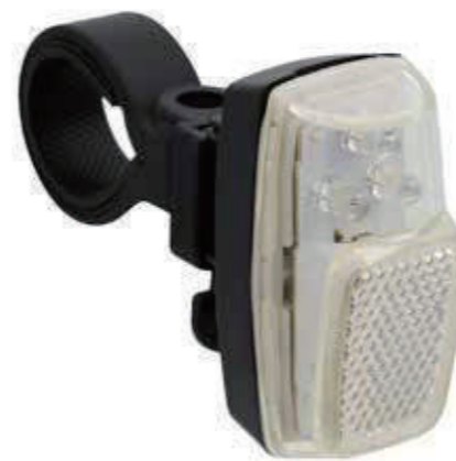
YC 770F / 电池前位置灯