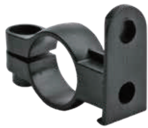
YC 10XE / 固定车把支架