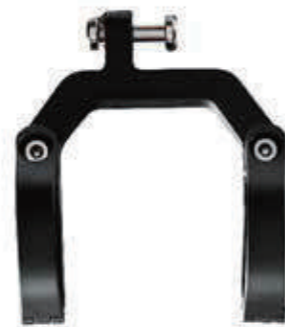
YC 12XE / 固定车把支架