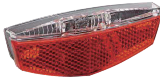
YC 107R / 后灯