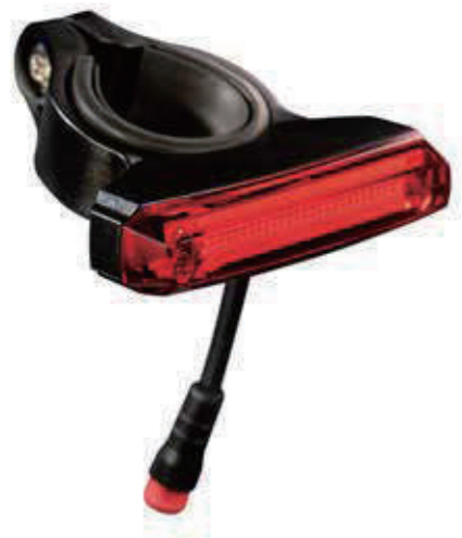
YC 327R / 后灯