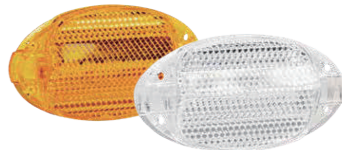
YC011P / 侧反射器

标准 / Standard AS | BS | CPSC | ISO | GB/T31887.2 | JIS