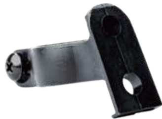
YC 30XE / 固定座管支架