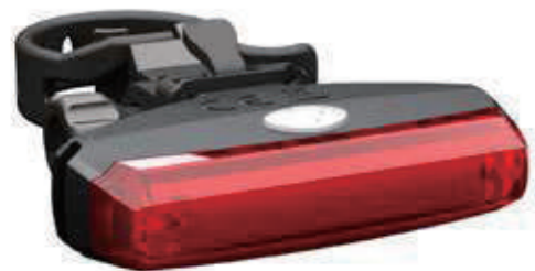
YC 243R / 电池后灯