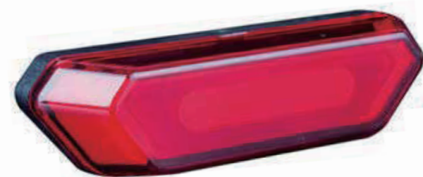
YC 020R / 后灯