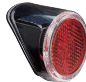
YC 252R / 太阳能后灯&驻车灯